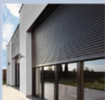
▶ ROLETA PODTYNKOWA SOLIDO

Przesłony zewnętrzne stanowią istotny element wyposażenia budynku. Odpowiednio dobrane będą przez lata gwarantowały komfort, bezpieczeństwo, a także energooszczędność użytkowania.