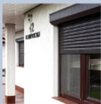
▶ ROLETA ELEWACYJNA